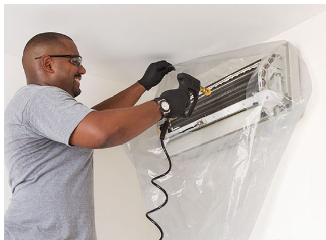
Nettoyage unité intérieure avec protection SPLIT-BAG (en option)