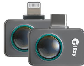
Versions IOS et Android